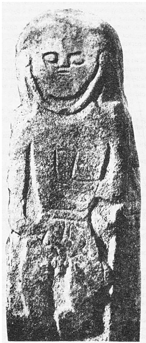
Изваяние скифского воина из святилища кургана Цыганча